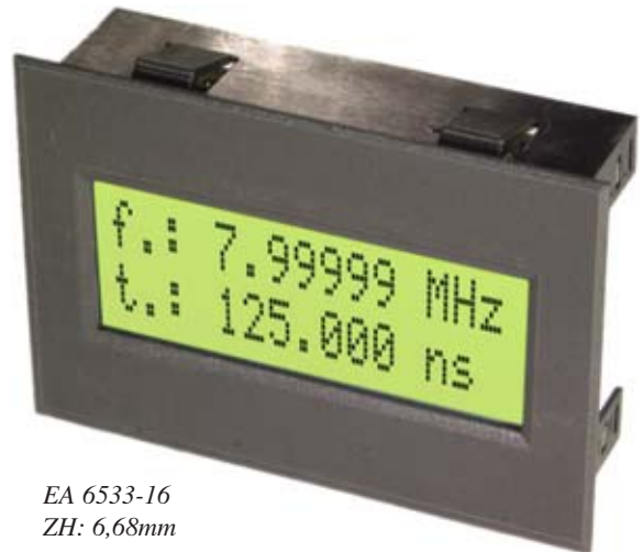
EA 6533-16 ZH: 6,68mm