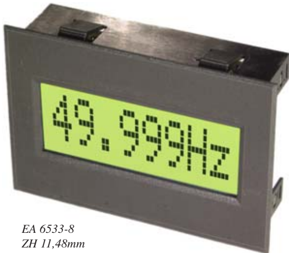
EA 6533-8 ZH 11,48mm